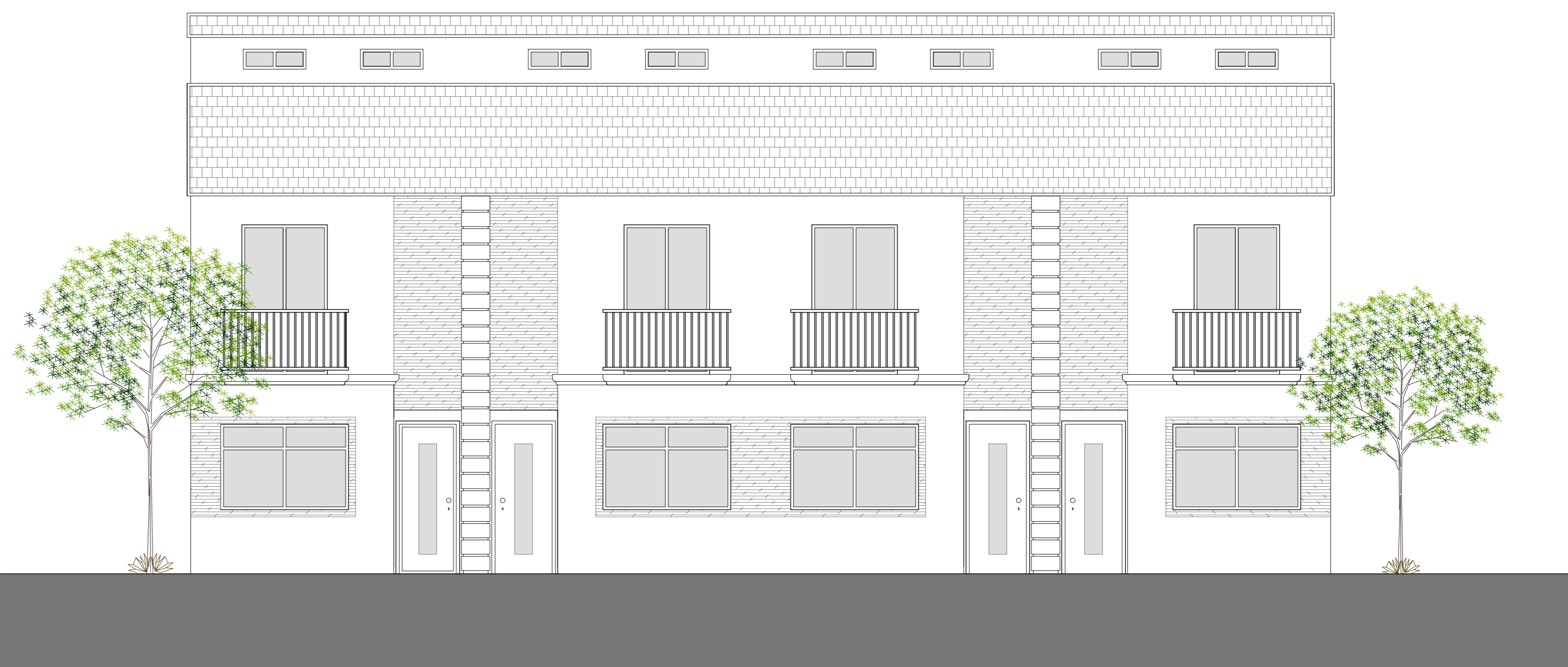
ELEVÇÃO FRONTAL - CONJUNTO DE 4 UNIDADES ESC. 1:50